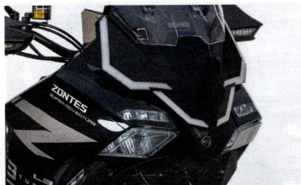
Natürlich LED-Licht. Ob's dunkle Nächte erhellt, konnten wir nicht testen

Ihre Dreizylindrigkeit, die seltsam eigenwillige Optik, welche eher an einen abgespaceten Großroller erinnert, sowie der zornig-supersportliche Klang, der ihrem Auspuff entweicht, stempeln die Zontes 703 F zum absoluten Exoten des Testfelds. Neben ihr wirkt selbst MV Agustas Enduro Veloce reichlich konservativ. Trotz gar nicht mal kurzer Federwege und „echter“ Enduro-Raddimensionen erscheint uns die Zontes als klar straßenorientiertes Adventurebike. Die breite Taille, das sofa-mäßige Sitzarrangement und das nicht ganz geringe Gewicht von 236 Kilo – auch sie fühlt sich schwerer an – lassen ernsthafte Geländeambition schnell verpuffen. Obwohl die Zontes die China-typischen Schwächen aufweist, darunter harsche Gasannahme, unsensibles Federbein und Minimalst-Funktion von ABS und Traktionskontrolle, hat sie uns auf einer flotten